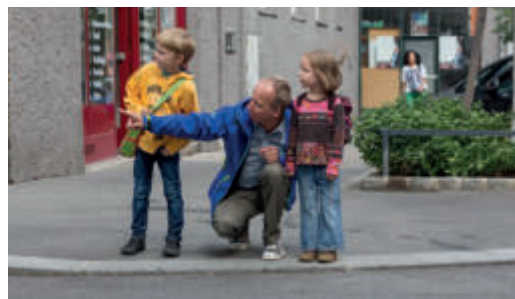
Regelmäßiges, gemeinsames Training ist wichtig!

Gehen Sie mit Ihrem Kind den Schulweg ab und erklären Sie ihm, warum es wo gefährlich ist und worauf es als Fußgängerin bzw. Fußgänger achten muss. Üben Sie problematische Stellen (siehe Schulwegplan) besonders gut. Beim nächsten Mal lassen Sie sich bereits von Ihrem Kind führen, das dabei über sein Verhalten spricht. So können Sie feststellen, ob es alles richtig verstanden hat und eventuell korrigierend eingreifen.