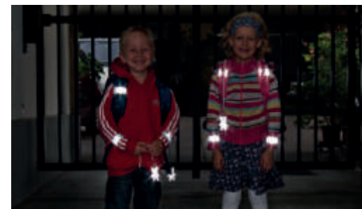
Sicherheit durch Sichtbarkeit!

Sorgen Sie dafür, dass Ihr Kind im Straßenverkehr rechtzeitig gesehen wird. Gerade im Herbst und Winter, wenn es in der Früh noch dunkel ist oder bei nebligem Wetter ist helle Kleidung von Vorteil. Noch besser wirken Reflektoren an Kleidung und Schultaschen – mit diesen können Kinder von Autofahrerinnen und -fahrern schon aus einer Entfernung von 130 Metern wahrgenommen werden.